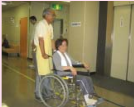
今日もリハビリ頑張りましょう!

平成23年1月には、現在建築中の新診療棟が開設となり、新しく充実した施設に期待が膨らみます。そして、今以上に多くのボランティアの方々のお力を借り、活動の場を広げていかななくてはと考えています。福岡大学病院では随時ボランティアを募集し歓迎しています。ボランティアに関心がある方、活動してみたいと思われる方は、ご自分の時間の許す範囲で、無理なくボランティア参加をされてみてはいかがでしょうか。私たち職員とともにボランティアの輪を広げていただく方を心よりお待ちしております。