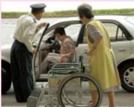
足もとに気を付けて下さいね。