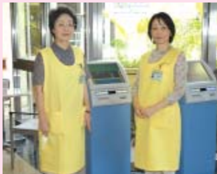
受付では私たちがお手伝いします。