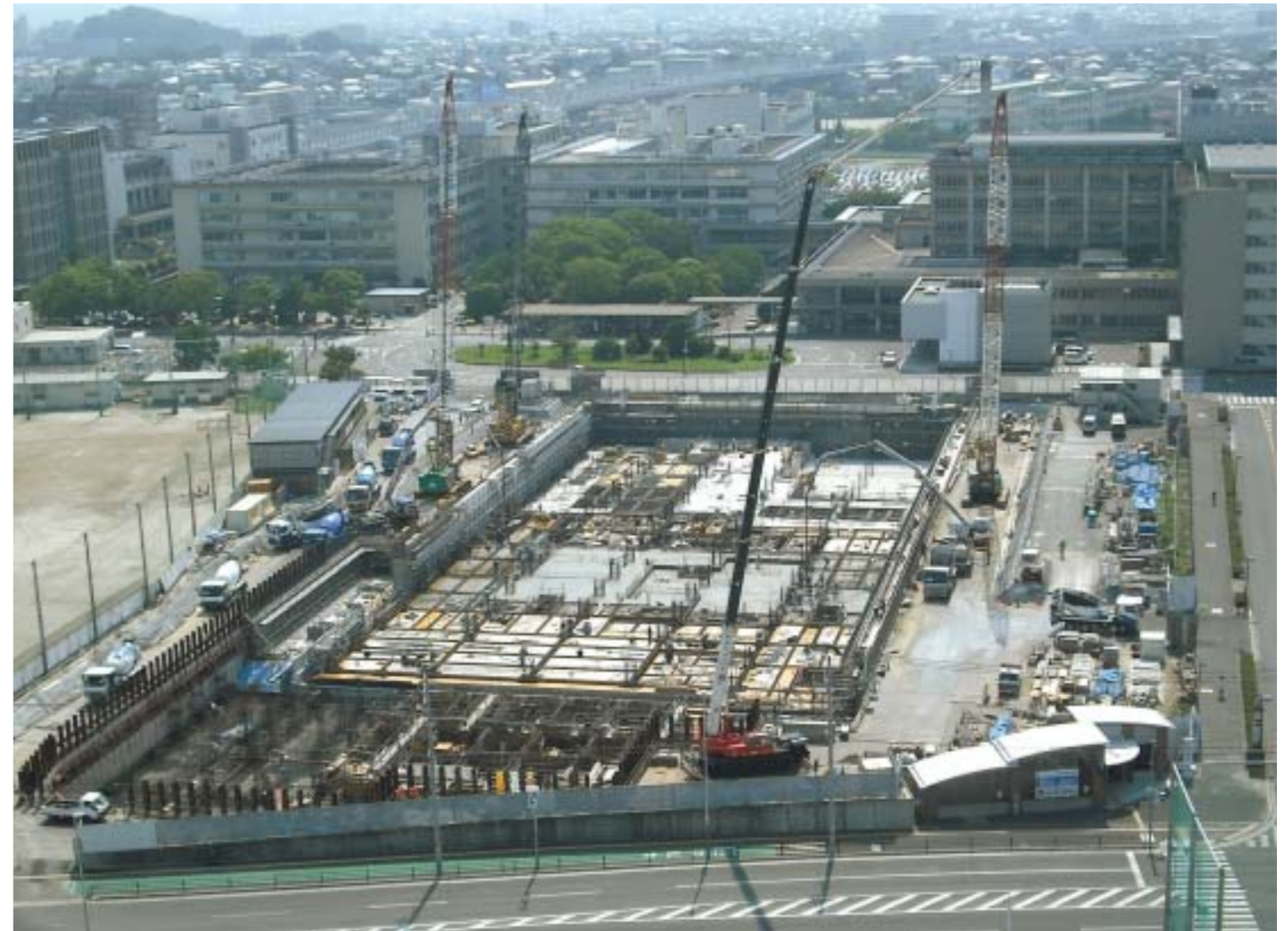
新診療棟建設中「平成23年1月オープン予定」

発行：医療情報部 URL：http://www.hop.fukuoka-u.ac.jp/