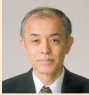
福岡大学病院 院長