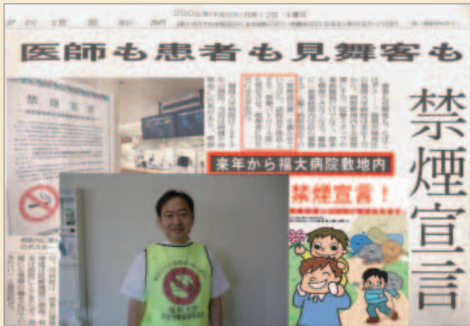
【上記記事のみ読売新聞より引用しています】

来年から、当院では喫煙しながらの入院はできなくなります。福岡大学病院は、患者様をはじめ地域の皆様、病院職員の健康を守るため、煙のないクリーンな病院作りに積極的に取り組んでまいります。ご協力とご理解を心からお願いいたします。